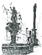
Rynek Fontanna z Neptunem